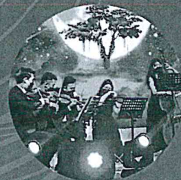
台北愛樂交響樂團