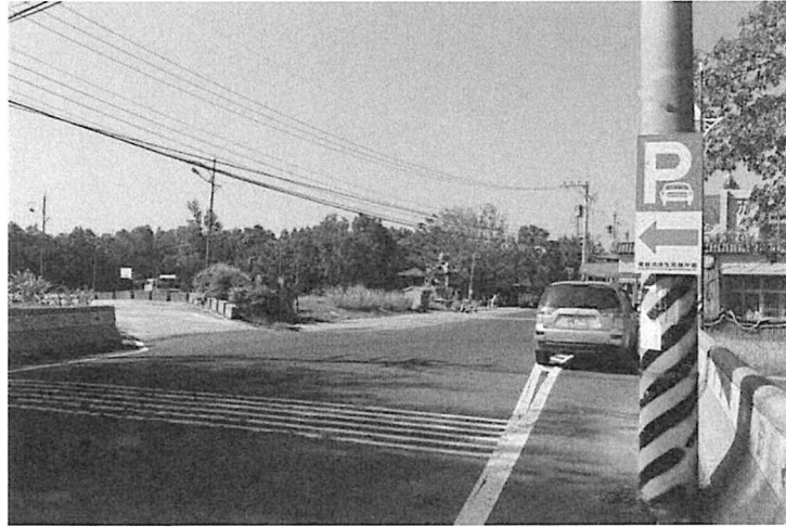
鰲鼓濕地森林園區停車空間指示牌誌