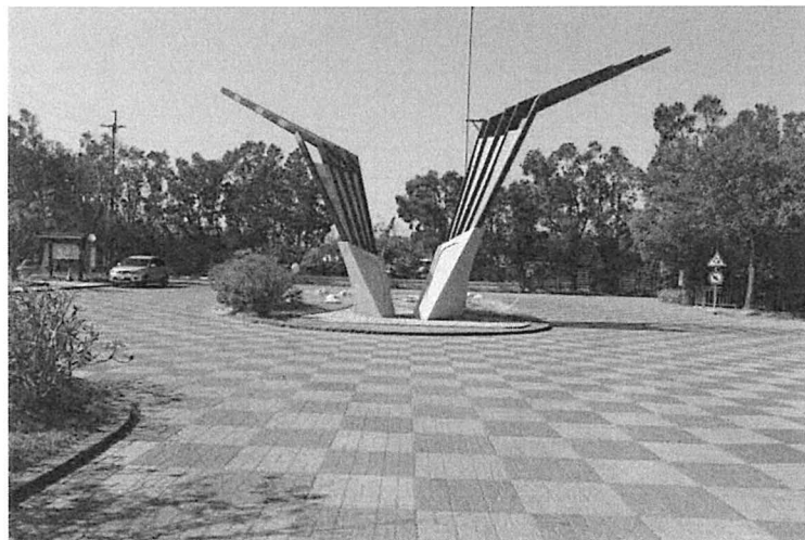
鷹揚鰲鼓圓環，僅供遊客下車