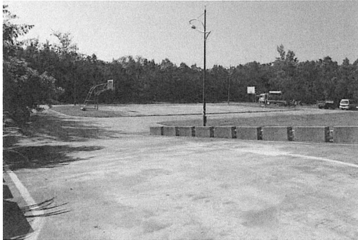
鰲鼓濕地森林園區停車空間