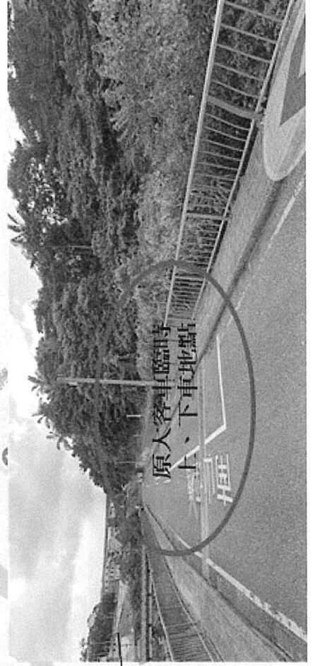
原大客車臨時上、下車地點